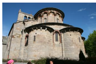
L'église de Saint-Urcize formée de plusieurs petites chapelles.

L'église de style Roman est très belle avec son clocher à peigne et son balcon ou tribune qui accueillait les hommes. La coquille figurant au-dessus de la porte d'entrée de l'église, sous le porche, rappelle que Saint-Urcize fut au Moyen-Age une étape du pèlerinage de Saint-Jaques de Compostelle.