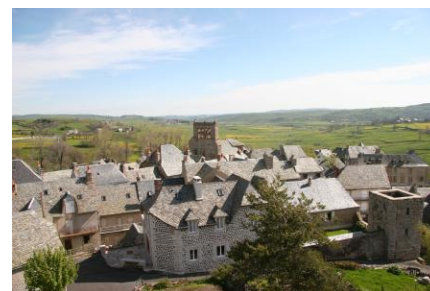
Saint-Urcize vu de l'observatoire.

Saint-Urcize se dresse à 1000 mètres d'altitude sur un roc basaltique. Nous sommes montés à un observatoire et vu d'en haut, le village est magnifique avec ses toits d'ardoises grises et ses maisons en pierre. On dirait un village du Moyen-Age avec ses rues étroites, ses vieilles demeures et ses fontaines.