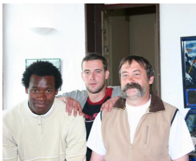
Devinez qui est qui ?

C'est le clown de service ! Il est noir et il est grand car il mesure 1m87. Il adore les enfants et il est resté lui aussi un grand enfant. Il est très rigolo et on l'a beaucoup apprécié.