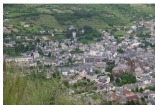
Espalion vue depuis le château

* Il a été construit il y a 1 000 ans sur un piton basaltique, d'où sa vue exceptionnelle sur la ville d'Espalion et les Monts d'Aubrac. Depuis 1987, on a entrepris sa restauration.