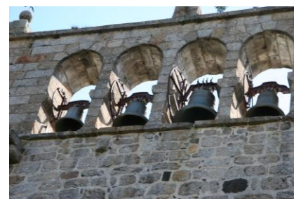
Le clocher de l'église de Saint-Urcize, il possède une des plus anciennes cloches de France (1583).

L'église de style Roman est très belle avec son clocher à peigne et son balcon ou tribune qui accueillait les hommes. La coquille figurant au-dessus de la porte d'entrée de l'église, sous le porche, rappelle que Saint-Urcize fut au Moyen-Age une étape du pèlerinage de Saint-Jaques de Compostelle.