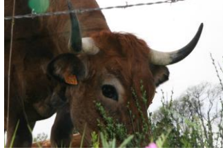
Léa, Quentin et Ludovic

Les vaches de la race d'Aubrac ont le museau, le bout des cornes, le tour des yeux et les sabots noirs. Les taureaux de la race d'Aubrac ont toujours le cou noir. Les vaches voient en noir et blanc ainsi que le mouvement. Les paysans font cette race pour leur viande. La reproduction se fait de manière naturelle. Il y a un taureau pour 25 vaches. Les vaches portent des prénoms. Souvent, c'est un nom de fleur.