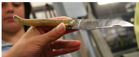
Un Laguiole authentique.