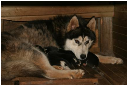
La chienne et ses chiots de quelques jours.

Des bébés huskies sont nés la veille de notre arrivée. Ce sont des huskies de Sibérie. Mais ils sont nés en France. Ils peuvent courir jusqu'à 200 kilomètres par jour. Ils sont très rapides et très endurants. Il y avait 10 huskies : Valise, Méga, Volga, Shoki, Vioupy, Viking, Youki, Voxan, Youkon, Wolfi . On a fait la cani- rando avec 9 huskies.