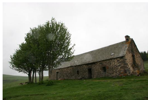
Le buron de Canuc

Le buron est une construction en pierre (basalte : roche volcanique) et couverte de lauzes. C'est « la maison de l'été » des buronniers, là où ils fabriquent le fromage. Pendant la transhumance des bovins sur le plateau de l'Aubrac du 25 mai au 13 octobre, les buronniers vivent isolés au milieu du troupeau dans ces burons. En 1900, on comptait près de 300 burons sur le plateau. Aujourd'hui, il n'en reste plus que deux ou trois à vocation touristique.