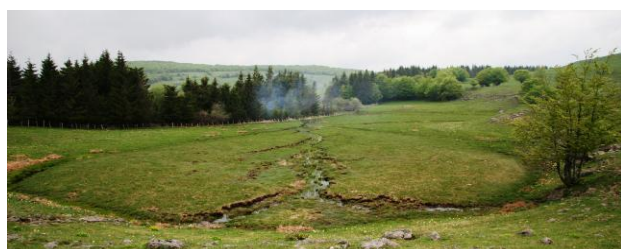
Une tourbière en forme de cœur.