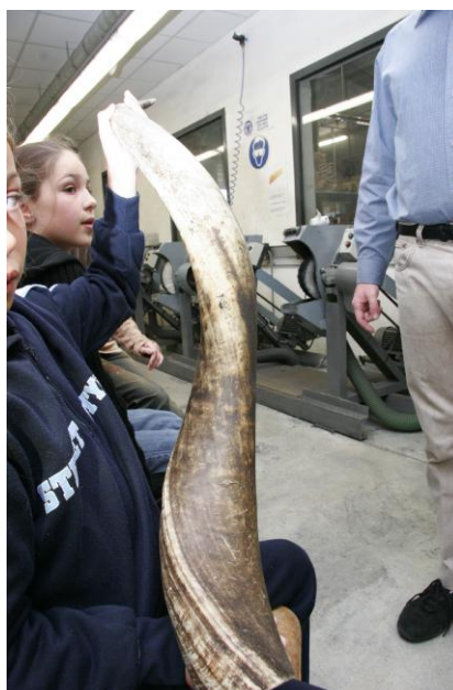
Une corne de zébu.