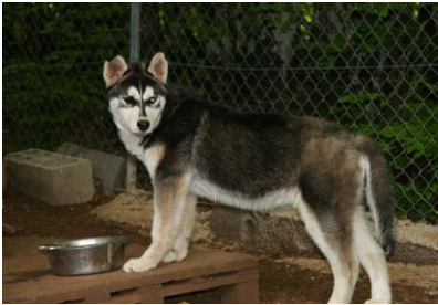
Un jeune husky de 6 mois.

En anglais, husky veut dire roque mais les huskies n'aboient pas vraiment. Ils mangent un repas par jour (croquettes ou viande de bœuf). Le mois de mai, ils perdent leurs poils de l'hiver après l'âge d'un an. Tous les trois mois, ils se purgent, ils mangent de l'herbe ou